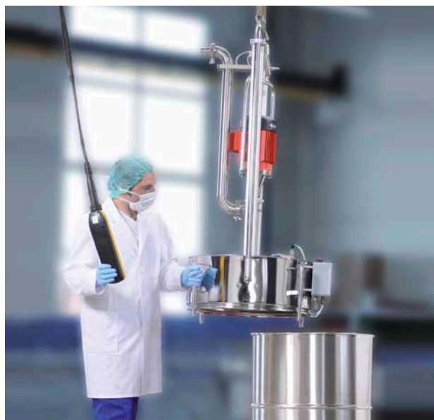
Mobiler Einsatz mit Kran oder Gabelstapler.