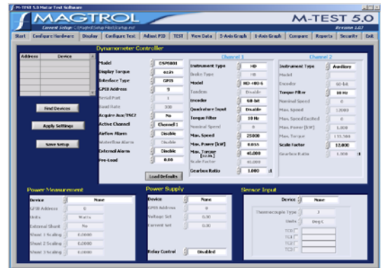
M-TEST 5.0 硬件配置