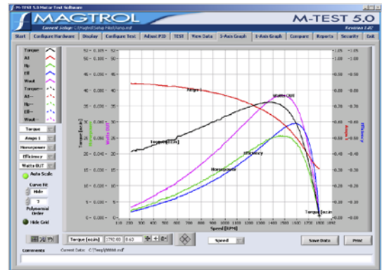
M-TEST 5.0 图解数据输出