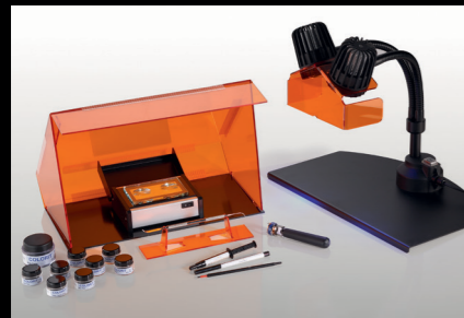
COLORIT® Set Desk Power DP2