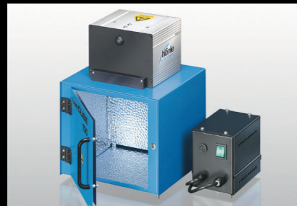
COLORIT® Light Cube