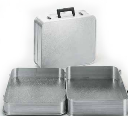
Modell A 1489 / 24