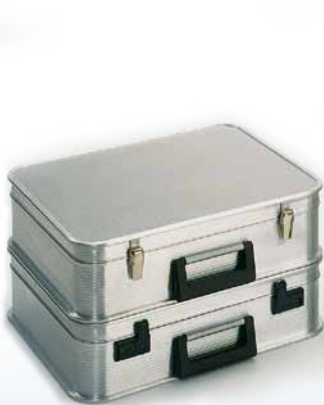
Modell A 1439 / 19