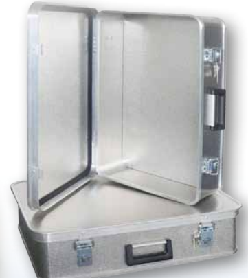
Modell A 1539 / 36