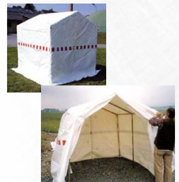
Details: beidseitig PVC-beschichtetes PSE-Gewebe ca. 600g/qm, verrottungsfest Farbe: weiß/transluzent Gerüst: Stahlrohrgerüst, 32/1,5mm, goldpassiviert, zusammenlegbar