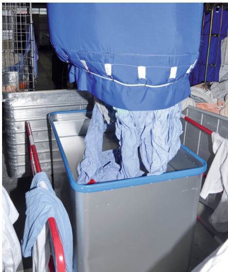
Federbodenwagen für ergonomisches und effizientes Arbeiten