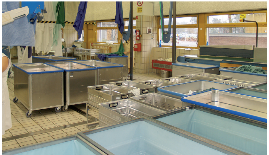
Einsatz von Federbodenwagen und Körben in der Wäscherei