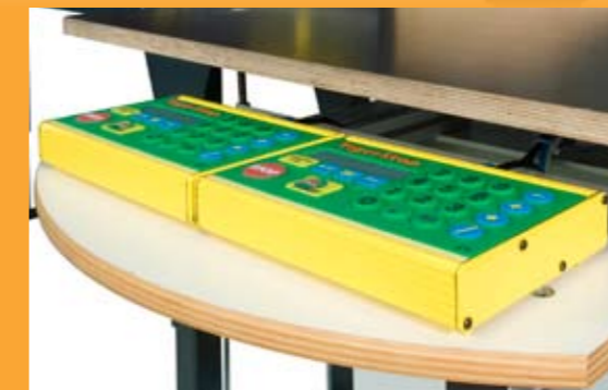
Automatische hoekinstelling met Tigerstop servo drive systeem