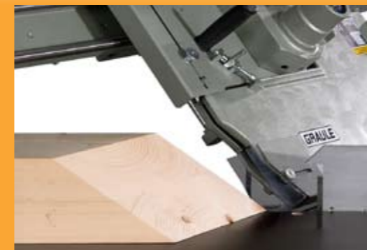
Instelnauwkeurigheid 0,05 graden