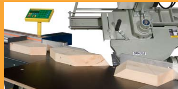
Maximale balkafmetingen tot 200 x 420 mm Houtlengtes tot 8,5 m standaard (optie tot 15 m)