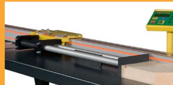
Automatisch positionering met Tigerstop opduwer