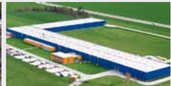
Hörmann Legnica Sp. z o.o., Polen