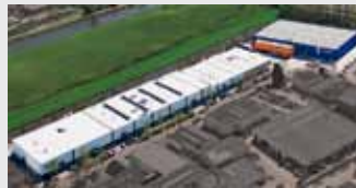
Hörmann Alkmaar B.V., Nederland