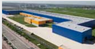
Hörmann Tianjin, China