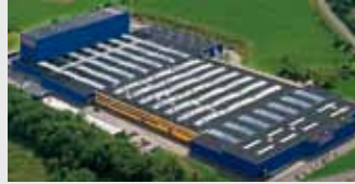
Hörmann KG Freisen, Duitsland