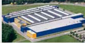
Hörmann KG Eckelhausen, Duitsland