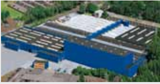
Hörmann KG Amshausen, Duitsland