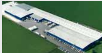
Hörmann LLC, Montgomery IL, USA