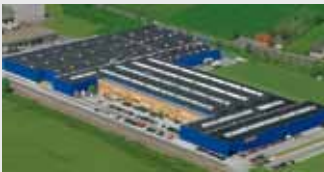
Hörmann KG Werne, Duitsland