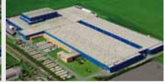
Hörmann KG Ichtshausen, Duitsland