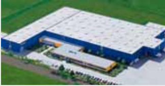
Hörmann KG Dissen, Duitsland