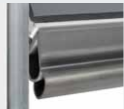
Elastische klembeveiliging tegen het kneuzen van de voeten