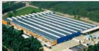
Hörmann Genk NV, België