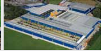
Hörmann KG Brockhagen, Duitsland