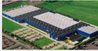
Hörmann KG Brandis, Duitsland