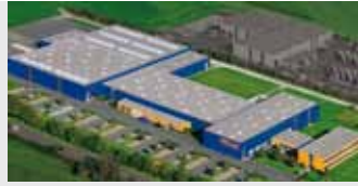
Hörmann KG Antriebstechnik, Duitsland