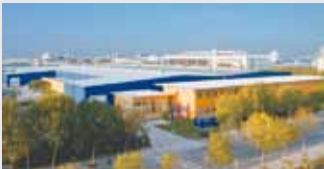
Hörmann Beijing, China