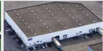
Hörmann Flexon, Leetsdale PA, USA

De Hörmann-groep biedt, als enige fabrikant op de internationale markt, alle belangrijke bouwelementen uit één hand. Ze worden in hooggespecialiseerde fabrieken vervaardigd volgens de nieuwste stand van de techniek. Door het overkoepelende verkoops- en servicenet in Europa en de aanwezigheid in Amerika en China is Hörmann uw sterke internationale partner voor hoogwaardige bouwelementen. In een kwaliteit zonder compromissen.