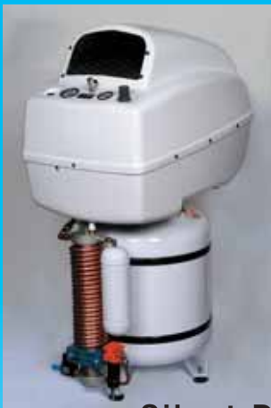
Silent DE 254