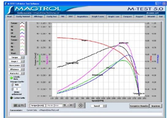
M-TEST 5.0 Affichage graphique des mesures