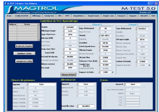
M-TEST 5.0 Fenêtre de configuration hardware