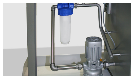
Pompe et filtre