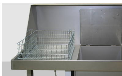
Panier de nettoyage en train d'égoutter