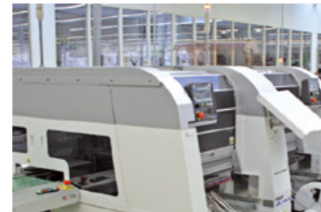
Fertigungshalle Production Hall