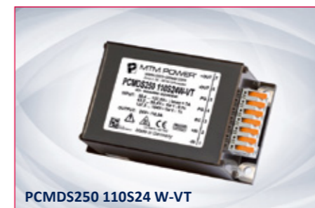
PCMDS250 110S24 W-VT