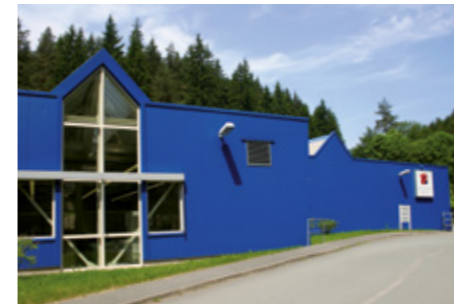
Werk 2 – Mellenbach Elektronikfertigung

Facility 1 – Mellenbach Administration and Development