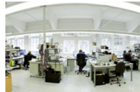
Entwicklungsabteilung R&D Department