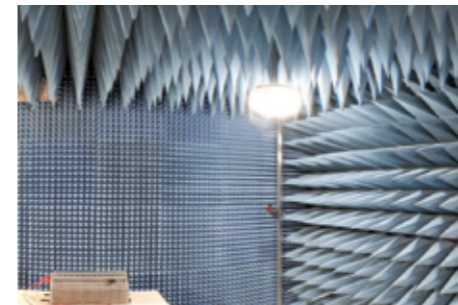
EMV-Labor EMC Laboratory