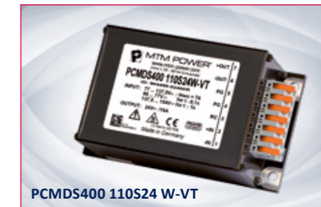
PCMDS400 110S24 W-VT