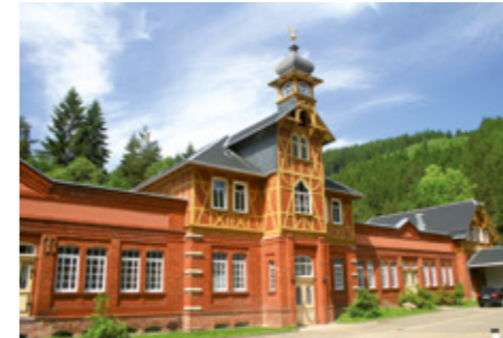
Werk 1 – Mellenbach Verwaltung und Entwicklung

Facility 1 – Mellenbach Administration and Development