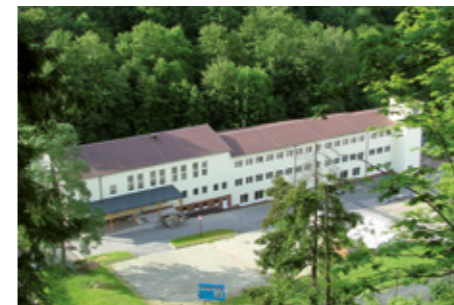
Werk 3 – Unterweißbach Transformatorbau

Facility 2 – Mellenbach Electronic Power Supplies Production