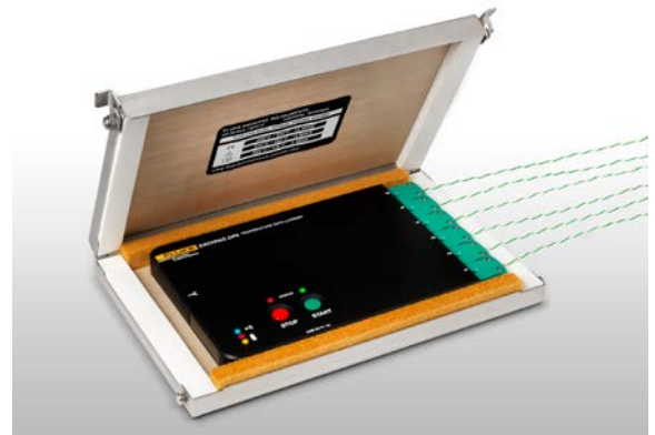
Datenlogger Datapaq DP5 mit Hitzeschutzbehälter

Dieses System wurde speziell für den Einsatz im Hochtemperaturbereich entwickelt und liefert Temperaturdaten in Echtzeit. Es hat sich in den verschiedensten Wärmebehandlungsprozessen bewährt, von Kochprozessen in der Lebensmittelindustrie bis zur Erwärmung von Stahlbrammen.