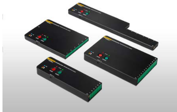
Datenlogger Datapaq DP5

Reflow Insight enthält die Funktion Easy Oven Setup, die automatisch die optimalen Ofeneinstellungen für das jeweilige Produkt berechnet. Damit sparen Sie bei jedem Produktwechsel Zeit.