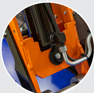
Verstärkte untere Zylinderhalterung