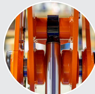
Verstärkte obere Zylinderhalterung