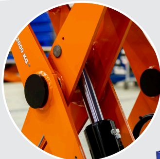
Doppelte Flachstahlarme für eine stabile Konstruktion