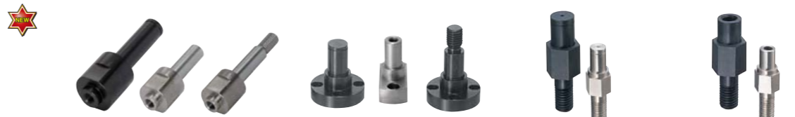
-Typ pro silné zatížení- -Typ s nákrůžkem- -Pro napínání- 665 667 669