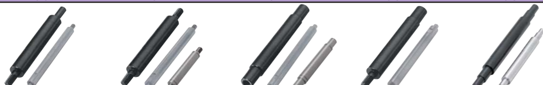
-Typ s osazením na obou koncích, s vnějším závětem na jednom konci- -Typ s vnějším závětem a osazením na obou koncích- -Typ s vnitřním závětem a osazením na obou koncích- -Typ s osazením na obou koncích, s vnitřním závětem na jednom konci, s vnějším závětem na druhém konci- -Typ s dvojitým osazením na obou koncích- 625 625 627 627 629