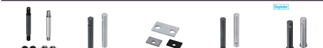
-Typ s vnějším závětem na obou koncích- -Jeden konec s klinovou drážkou- Klíny pro čepy závěsů -Čepy závěsů-Typ s ploškou pro stavění šroub- -Typ s ploškou pro stavění šroub s nákrůžkem- 679 680 680 681 681