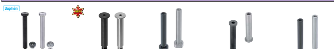
-Typ s pojistnou maticí a hlavou s vnitřním šestihranem- -Typ s pojistnou maticí a sníženou hlavou s vnitřním šestihranem- -Typ s vnitřním závětem a nákrůžkem- -Typ s vnitřním závětem, hlavou s vnitřním šestihranem a nákrůžkem- -Typ s vnitřním závětem na obou koncích- 676 677 678 678 679