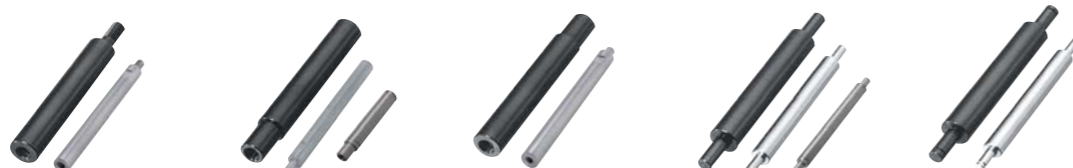
-Typ s vnějším závětem a osazením na jednom konci, s vnitřním závětem na druhém konci- -Typ s vnitřním závětem a osazením na jednom konci- -Typ s osazením na jednom konci, s vnitřním závětem na obou koncích- -Typ s osazením na obou koncích, standardní typ- -Typ s osazením na obou koncích, s drážkami na pojistný kroužek- 619 621 621 623 623