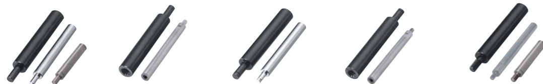
-Typ s osazením na jednom konci, standardní typ- -Typ s osazením na jednom konci, s vnitřním závětem na druhém konci- -Typ s osazením na jednom konci, s drážkou na pojistný kroužek- -Typ s osazením na jednom konci, s drážkou na pojistný kroužek a vnitřním závětem- -Typ s vnějším závětem a osazením na jednom konci- 615 615 617 617 619