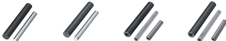
Název výrobku Rotační hřídele-Rovný typ- -S drážkami na pojistné kroužky na obou koncích- -Typ s vnitřním závětem na jednom konci- -Typ s vnitřním závětem na obou koncích- Strana 611 611 613 613

Rotační hřídele/ Konzolové hřídele/ Čepy závěsů