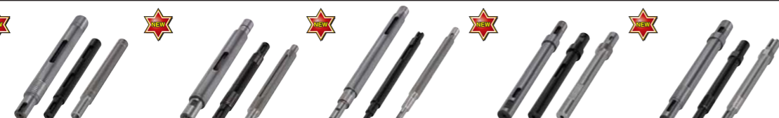
Hnací hřídele-Typ s osazením na jednom konci- -Typ s osazením na obou koncích- -Typ s osazením na jednom konci, s dvojitým osazením na druhém konci- -Typ s nákrůžkem- -Typ s osazením na jednom konci a nákrůžkem- 637 639 641 643 645