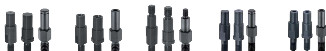
Konzolové hřídele-Montážní typ s vnějším závětem a drážkou na pojistný kroužek- -Montážní typ s vnějším závětem a vnitřním závětem- -Typ s vnějším závětem na obou koncích- -Vozíkový typ s vnějším závětem a drážkou na pojistný kroužek- -Vozíkový typ s vnějším závětem a vnitřním závětem- 647 649 651 653 655

• Tolerance rozměru L u čepů závěsů bez specifikace spadá do střední třídy tolerance (m) řezného rozměru JIS B 0405.