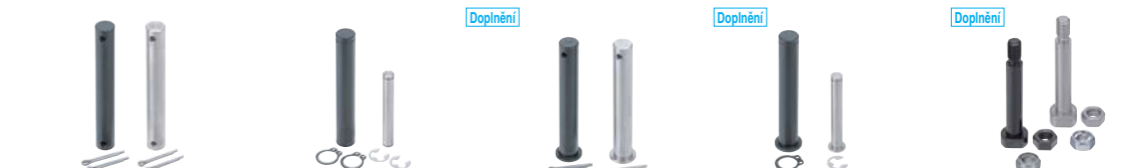
Čepy závěsů-Typ se závlačkami- -Rovný typ s pojistnými kroužky- -Typ se závlačkou a nákrůžkem- -Typ s pojistným kroužkem a nákrůžkem- -Typ s pojistnou maticí a nákrůžkem- 671 672 673 674 675