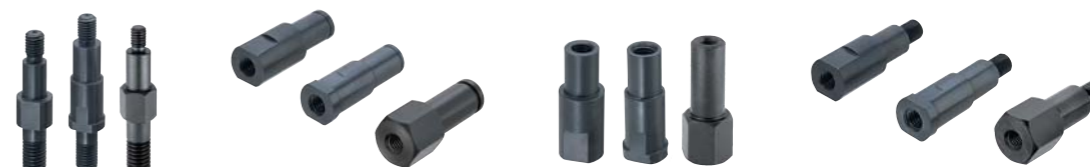
-Vozíkový typ s vnějším závětem na obou koncích- -Typ s montáží na šroub a drážkou na pojistný kroužek- -Typ s montáží na šroub a vnitřním závětem- -Typ s montáží na šroub a vnějším závětem- 657 659 661 663

• Tolerance rozměru L u čepů závěsů bez specifikace spadá do střední třídy tolerance (m) řezného rozměru JIS B 0405.