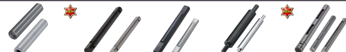
Trubkové rotační hřídele-Lehčené, rovný typ- Rotační hřídele-Pro napínání- -Pro aretaci- -Kombinovaný typ s tvarovanými konci- Hnací hřídele-Rovný typ- 630 631 631 633 635