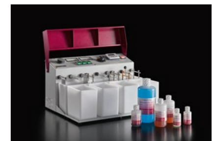
Galvanogeräte / -chemie Electroplating units / chemicals