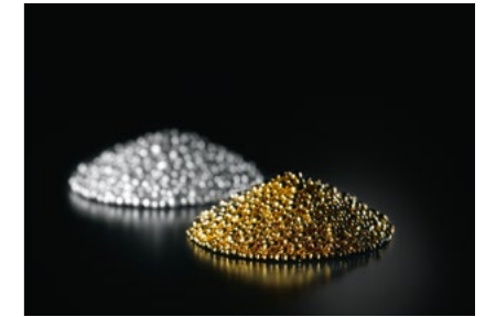
Edelmetall-Handel Precious metals trading