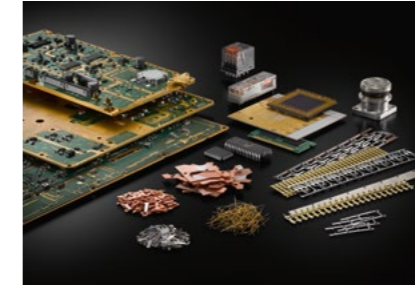
Industrie-Recycling Industrial refining