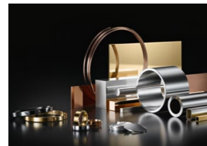
Edelmetall-Halbzeuge | Precious metals semi finished products