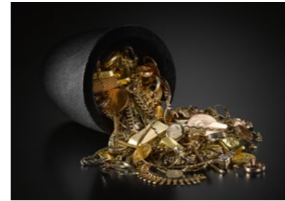
Edelmetall-Recycling Precious metals refining