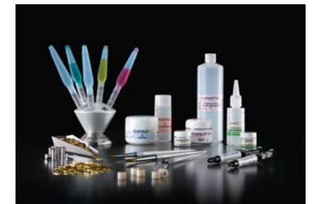
Dentalprodukte Dental products