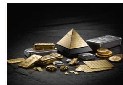
Investmentprodukte Investment products