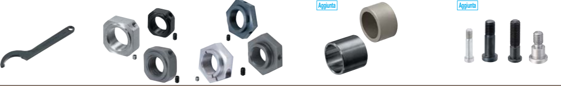
Chiavi a settore per dadi cuscinetti Controdadi a serraggio forte per cuscinetti-Quadrati/esagonali- Distanziali per cuscinetti-Per anelli interni, esterni- Perni finecorsa per cuscinetti 767 768 769 771