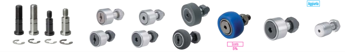
Perni finecorsa per cuscinetti con gola per anello di sicurezza Perni folli-Standard- -A esagono incassato- Perni folli rivestiti in uretano Perni folli in resina Perni folli eccentrici pieni Perni folli in miniatura 772 773 774 775 776 776 777