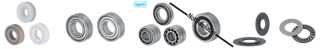
Cuscinetti a sfere in resina Cuscinetti a sfere senza grasso/olio per applic. speciali Cuscinetti a sfere angolari-Fila singola/doppia (standard)-Universali (precisione)- Paragrassi Cuscinetti a rullini reggispinta 755 756 757, 758 758 759