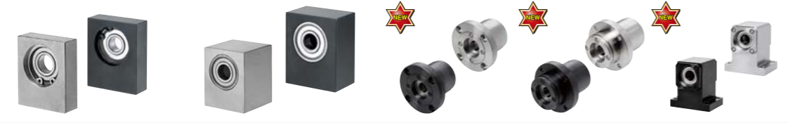
-Attacco inferiore altezza selez./specif.- -Doppio attacco inferiore altezza selez./specif.- Cuscinetti con supporto-Fissi con anello esterno- -Fissi con anello esterno, a inserto- -Fissi con anello esterno, a T- 735 736 738 739 740