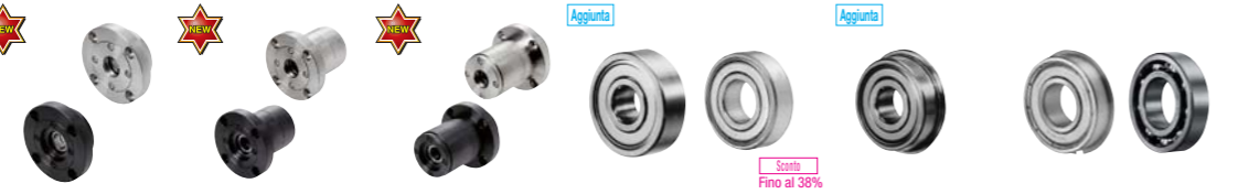
Cuscinetti angolari con kit supporto-Flangia--Angolari + Gola profonda/Flangia--Angolari + Gola profonda/A inserto- Cuscinetti a sfere a gola profonda/Piccoli-Doppia schermatura- Cuscinetti a sfere a gola profonda/Piccoli-Flangia- Cuscinetti a sfere a gola profonda-Doppia schermatura/aperti- 742 743 745 747, 748 749 750