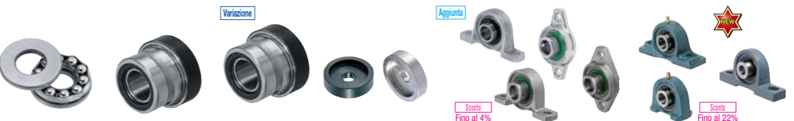
Cuscinetti a sfere reggispintaCuscinetti a rullini-Con cuscinetti a sfere reggispinta--Con cuscinetti a rulli reggispinta-Cappucci per alberi Cuscinetti a sfere-Supporto ritto, flangia a losanga- -Supporto ritto in acciaio fuso, attacco inferiore- 759 760 760 760 761 762