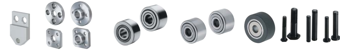
Staffe per perni folli Coperchi cuscinetto Rotelle-Separate/Piene- Rotelle in uretano Perni per rotelle 777 778 779 780 780