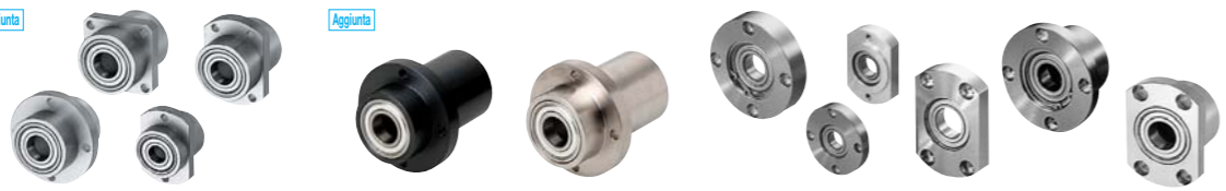
-Cuscinetti doppi a inserto senza anello di sicurezza, L selez./Dim. specif.-Cuscinetti doppi lunghi a inserto senza anello di sicurezza, dim. specif.-Cuscinetti ingrassati a basso accumulo di polvere con supporto-Singoli/doppi- 715-718 719 721,722