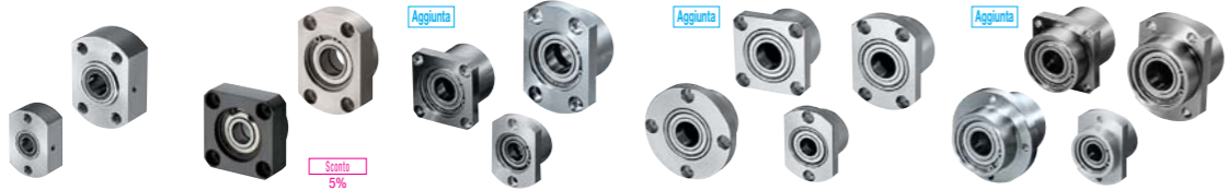
-Cuscinetti reggispinta--Cuscinetti doppi corti con anello di sicurezza--Cuscinetti doppi con anello di sicurezza, L selez./specif.-Cuscinetti doppi senza anello di sicurezza, L selez./specif.-Cuscinetti doppi a inserto con anello di sicurezza, L selez./specif.- 701 702 703-706 707-710 711-714