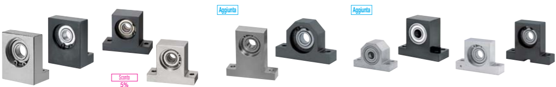
Cuscinetti con supporto-A L- -A T corti doppi- -A T- -A T doppi- Cuscinetti fissi con supporto-A T- 723 724 725 727 729