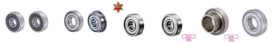
Cuscinetti a sfere a gola profonda/Piccoli-Schermatura in gomma- Cuscinetti a sfere ingrassati a basso accumulo di polvere- Cuscinetti a sfere riempiti di grasso termoisolanti fino a 160°C Cuscinetti a sfere riempiti di grasso termoisolanti fino a 230°C Cuscinetti con viti di fermo Cuscinetti a sfere per applic. speciali 1.401/302/18-10 751 752 753 754 754 755