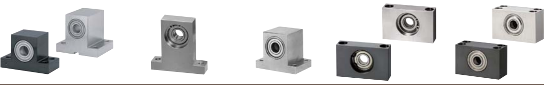
-A T doppi- Cuscinetti ingrassati a basso accumulo di polvere con supporto-A T- -A T doppi- Cuscinetti con supporto-Blocco--Blocco, doppi- 730 731 732 733 734