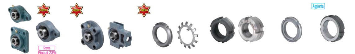
-Flangiato in acciaio fuso- -A inserto in acciaio fuso, scorrevole- Dadi e rondelle di sicurezza dentate per cuscinettiControdadi a serraggio forte per cuscinetti Fine U Nutse Controdadi di precisione 763 764 765 766 766 767