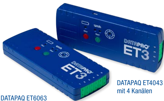
DATAQAQ ET6063 mit 6 Kanälen