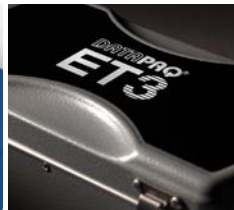
Hitzeschutzbehälter DATAPAQ TB0263*