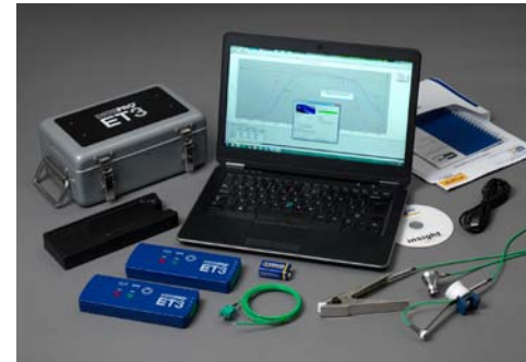
System DATAPAQ EasyTrack3