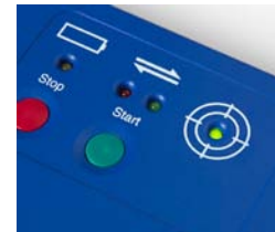
SmartPac* des Datenloggers DATAPAQ ET3