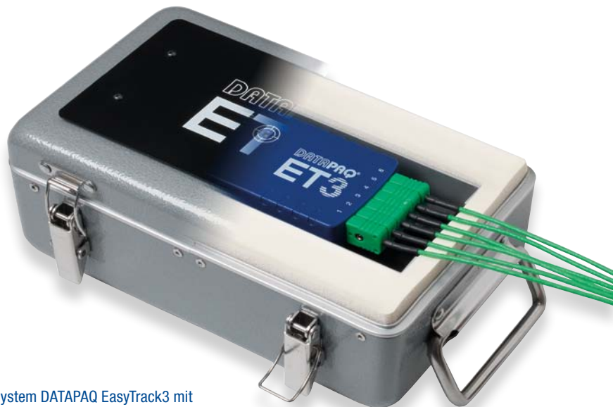
System DATAPAQ EasyTrack3 mit Standardhitzeschutzbehälter DATAPAQ TB0253