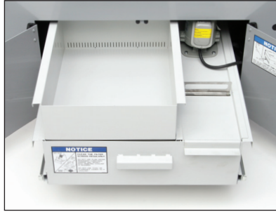
OM-2A, makinenin tabanında kaplanmış bir kaydırılabilir soğutma tankına ve pompasına sahiptir.